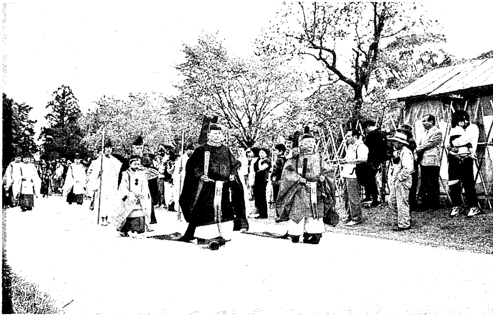
競馬会神事 左右念人を先頭に催奉行、後見、乗尻等が一の鳥居から二の鳥居を経て社頭に参進する図。このあと本殿前にて乗尻の奉幣の儀がある。

「系図展観」お知らせ 七月二十九日(日) 上賀茂神社(勸使殿)に於て系図の曝涼を兼て一般公開を実施します。(雨天中止)