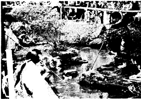
平成十四年四月十四日(日)上賀茂神社 涉成園で開催された曲水宴奉仕の童子 四君。